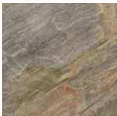
Vorher Mattes Erscheinungsbild

Ganz gleich, ob Sie geschliffene Natursteinflächen wieder zum Glänzen bringen oder ihre Farbe, Struktur und natürliche Schönheit betonen wollen, die Produkte der Linie STONETECH wurden speziell für eine nachhaltige Verbesserung der Leistungsmerkmale entwickelt. Sie finden mit Sicherheit das Produkt für Ihre ganz speziellen Anforderungen. Die Versiegelungsmittel und Farbverstärker STONETECH 2-in-1 sorgen für einen satteren, intensiveren und tieferen Farbton und gleichzeitig schützen und pflegen sie die Oberfläche.