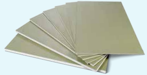
Data Sheet 040.0