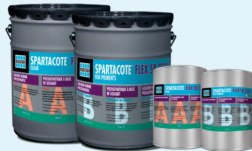
Data Sheet 36627