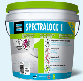
Data Sheet 36589.0