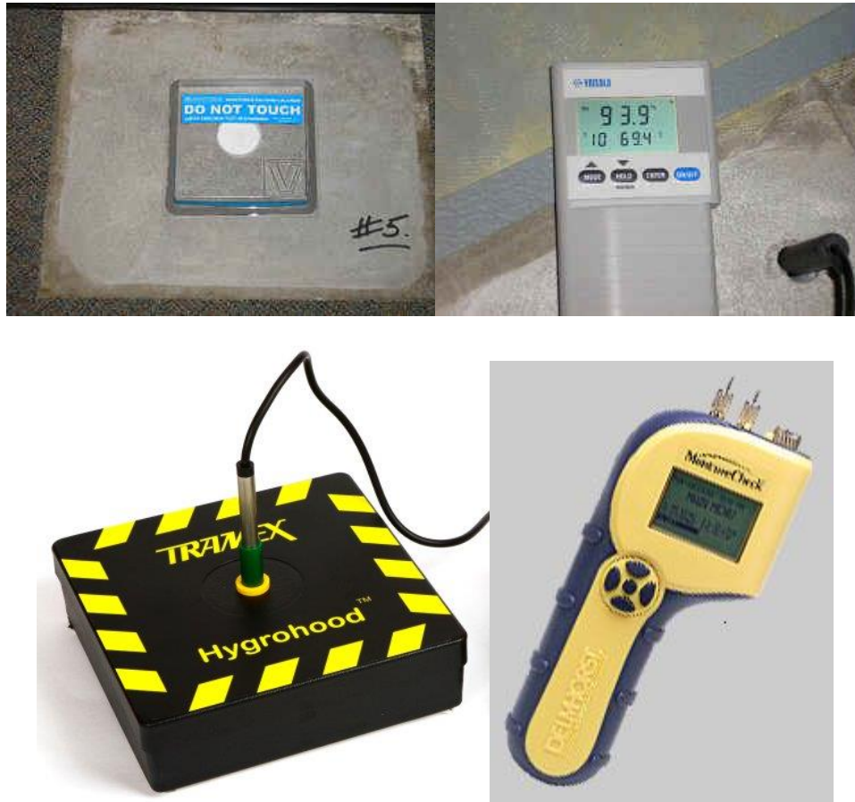
Figura 1.1 – (Desde arriba a la izquierda) ASTM F1869 Kit de prueba de cloruro de calcio, ASTM F2170 método de prueba de sonda de HR, ASTM F2420 Humedad relativa con cubierta aislada, y ASTM F2170 medidor de humedad

ASTM F1869, ASTM F2170 y ASTM F2420 son pruebas cuantitativas (que indican aproximadamente cuánta humedad hay) mientras que ASTM D4263 es una prueba cualitativa (que indica que la humedad está presente pero no cuánta), y todas son una "panorama" de emisión de vapor de humedad durante el período de prueba.