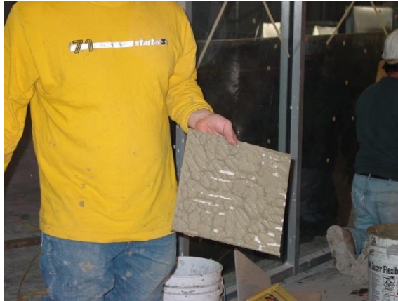
Picture 1.4 – Baldosa cerámica retirada durante la instalación para verificar que se está alcanzando la cobertura adecuada. Observe que la esquina inferior derecha de la baldosa carece de cobertura. Esto sin duda conducirá a una baldosa agrietada.

El tamaño de la baldosa también determinará exactamente qué herramientas se requieren para asentarla correctamente. En cuanto mayor sea la baldosa, mayor debe ser el tamaño de la llana dentada. Una llana dentada cuadrada de 1/4" x 1/4" (6 mm x 6 mm) podría estar bien para una baldosa de 4 1/4" x 4 1/4" (108 mm x 108 mm) pero no será adecuada para la instalación de baldosas de 20" x 20" (500mm x 500mm). Es importante que esto se entienda, y que el instalador trate de retirar la baldosa después de que se instale para asegurarse que la cobertura adecuada se logra y que la superficie de la instalación de baldosas es plana. Las normas de la industria requieren que se alcance una cobertura mínima del 80% para áreas interiores, no húmedas, y una cobertura mínima del 95% para cualquier instalación interior, húmeda o exterior. Ha habido avances significativos en la tecnología de llanas en los últimos años que ayudan a facilitar el trabajo del instalador. Las pautas generales para el tamaño de la llana / baldosa son;