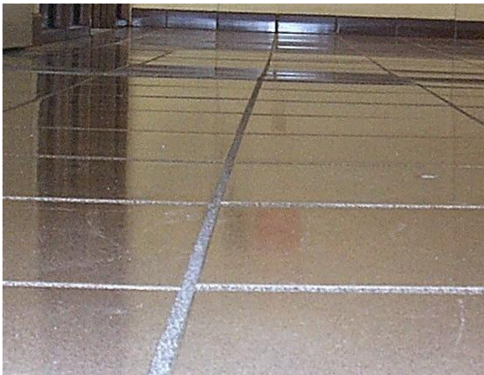
Picture 1-1 – Las baldosas de gran formato resaltan las imperfecciones en el sustrato.

Es importante tener en cuenta que una cierta cantidad desnivel es inevitable e inherente a las instalaciones de baldosas cerámicas y también puede ser inevitable debido a las tolerancias de baldosas, de acuerdo con ANSI A137.1- American National Standards Specifications for Ceramic Tile. Los manuales TCNA (página 34) y ANSI (página 26 – sección A108.02 4.3.7) proporcionan información sobre cuáles deben ser los niveles de tolerancia adecuados. En esta parte se discute el problema de nivelación excesiva.